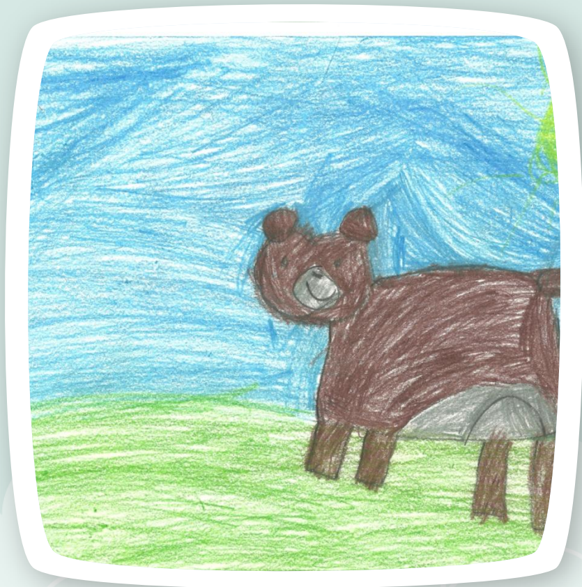
Gotowy praca ;-)