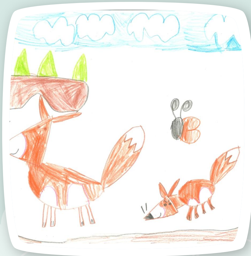
Końcowy efekt ;-)