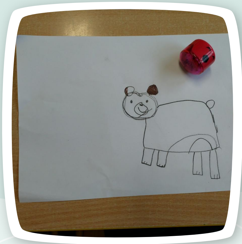
Miś Roksany na początku ;-)