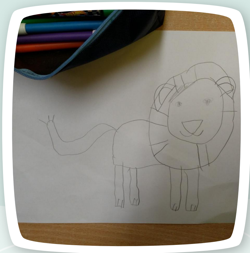
Początek pracy Pawełka nad lwem ;-)