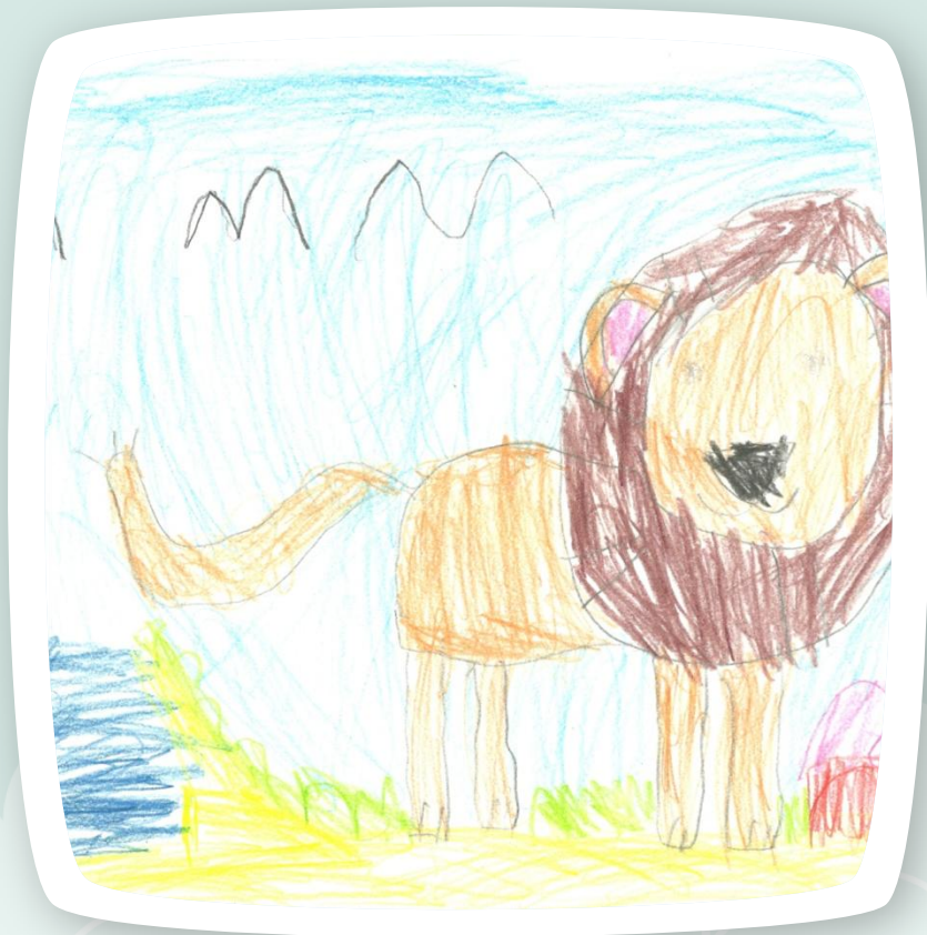
Końcowy efekt ;-)