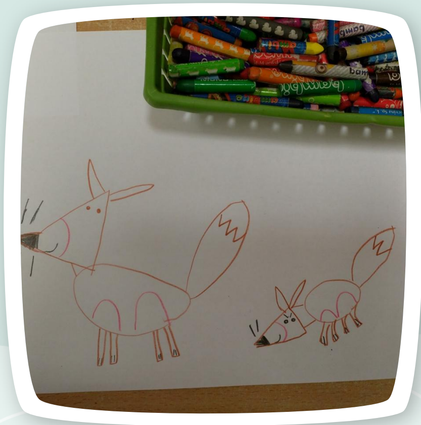
Początek pracy Amelki nad liskiem ;-)