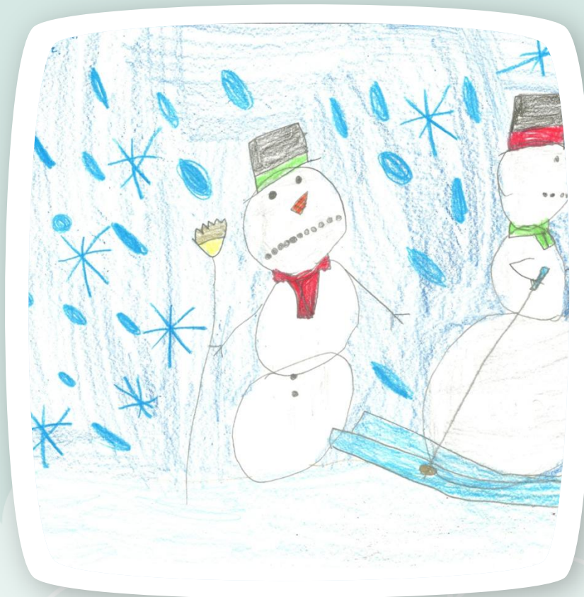
Końcowy efekt ;-)