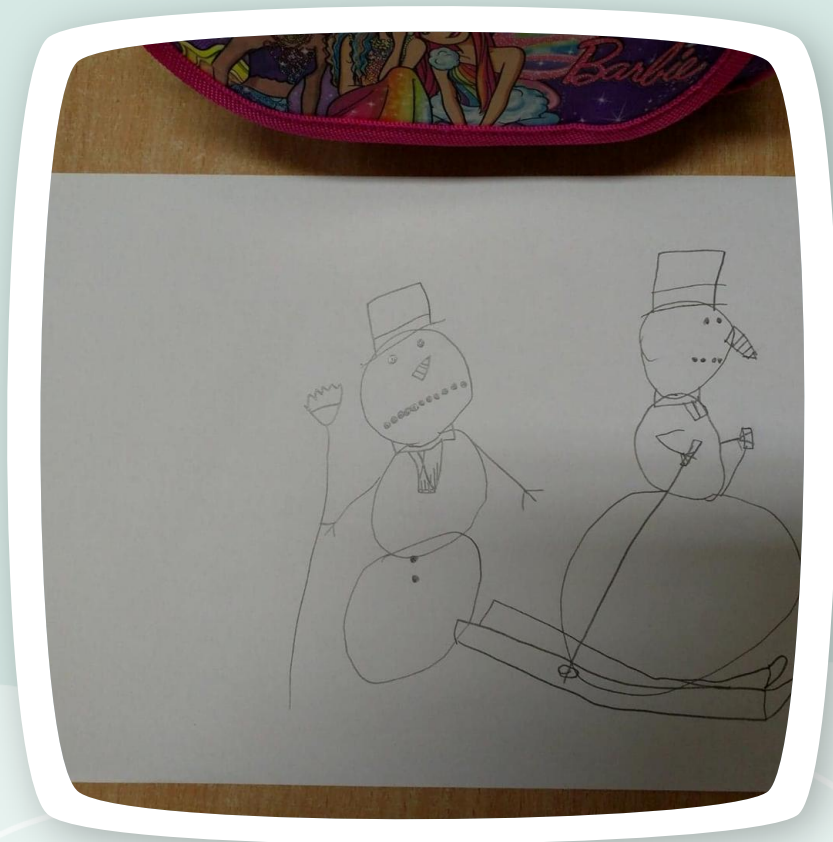
Początek pracy Milenki nad bałwankiem ;-)