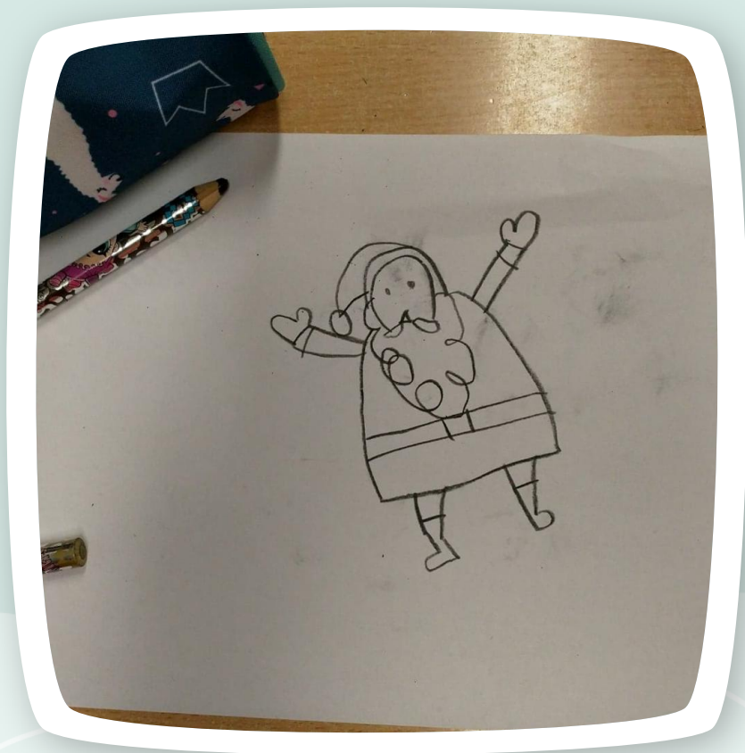
Mikołaj Zosi na początku ;-)