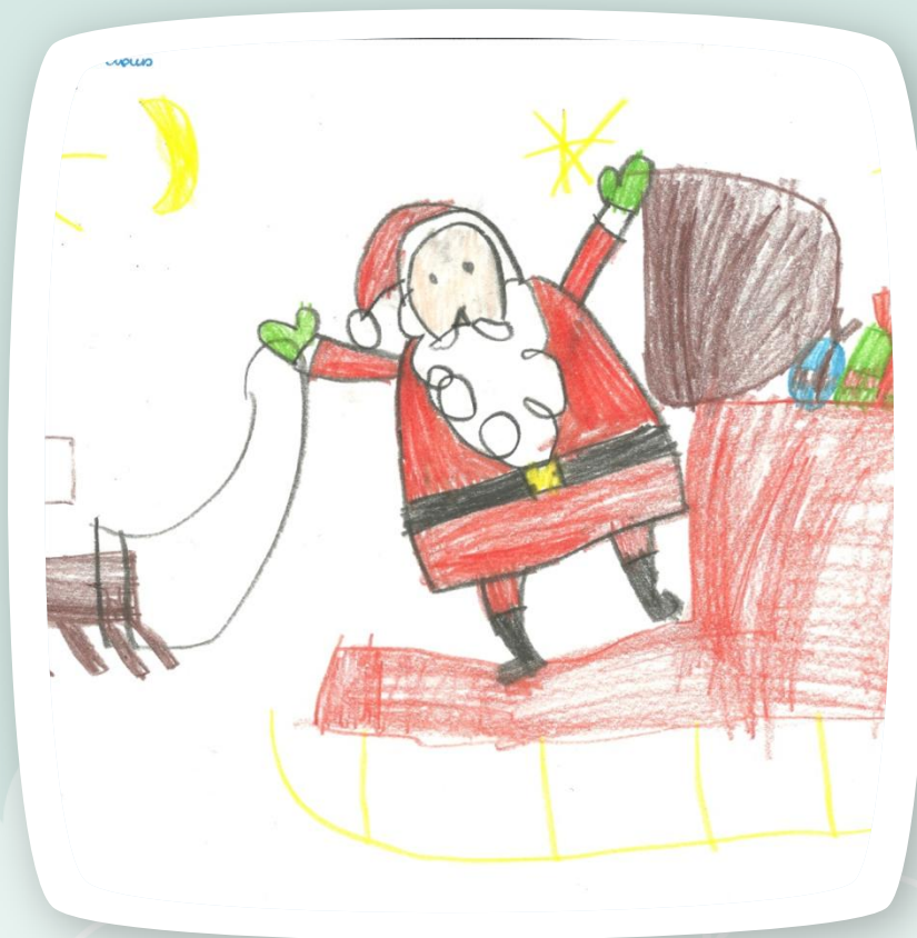
Gotowy praca ;-)