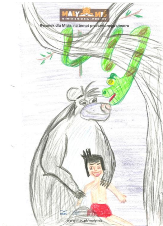
Zuzia Dz. "Księga Dżungli"