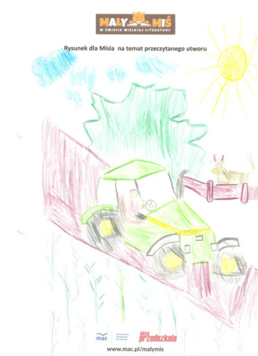
Pawełek J. "Maszyny i pojazdy"