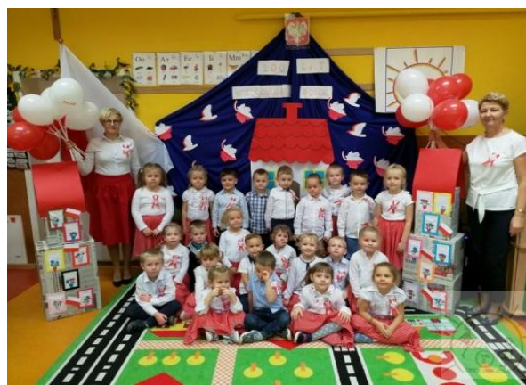
Święto Odzyskania Niepodległości