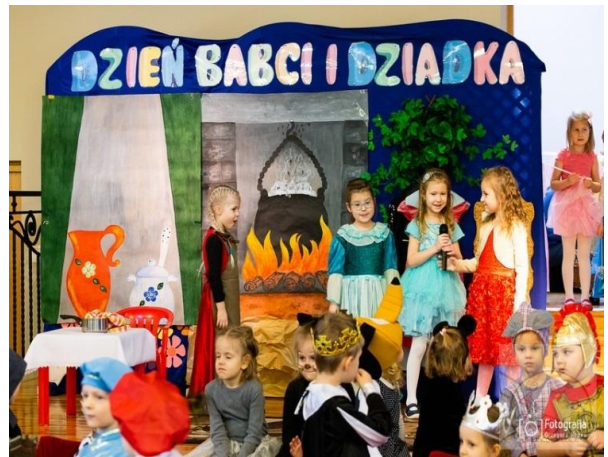
Dzień Babci i Dziadka