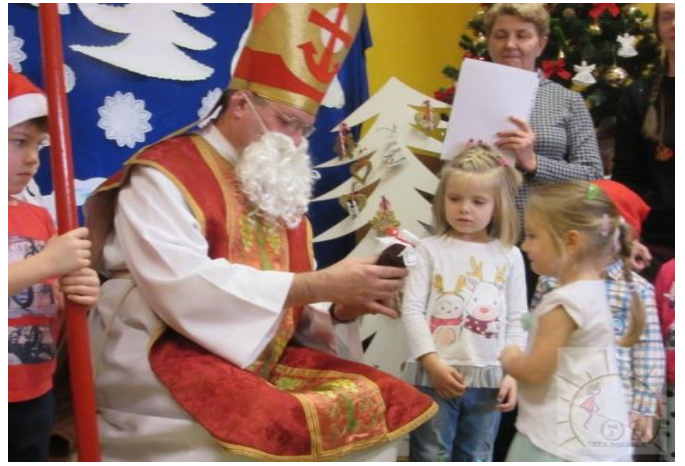
Spotkanie z Mikołajem