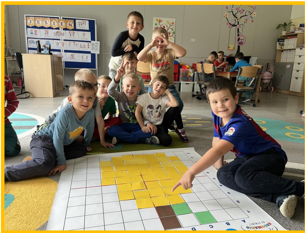
Tydzień Kodowania w grupie „Sowy”