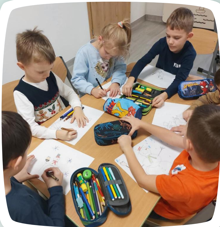
Grupa „Wiewiórki” podczas zajęć innowacyjnych ;-)