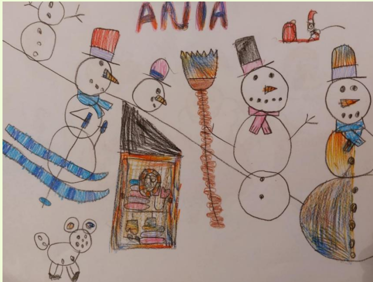
Praca Ani P.