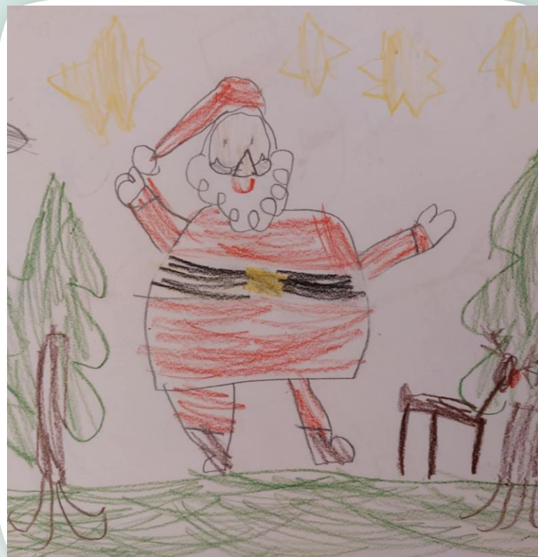
Rysunek Piotrka J. ;-)