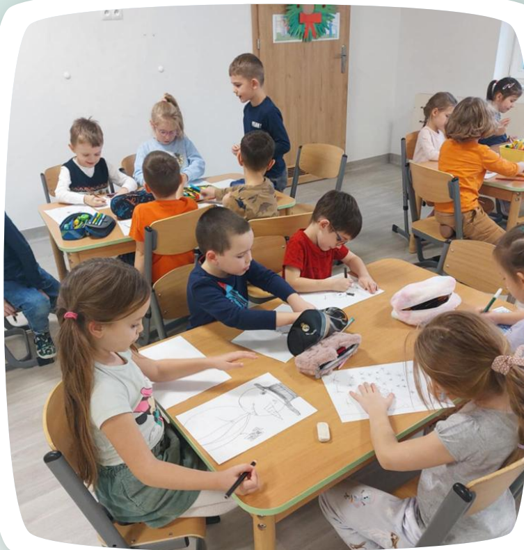
Wszyscy pracowali z wielkim zaangażowaniem;-)