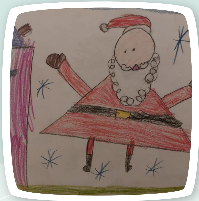
Mikołaj autorstwa Sofii I. ;-)