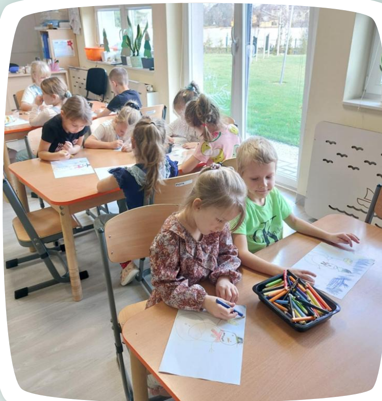
Wszyscy pracowali z wielkim zaangażowaniem;-)