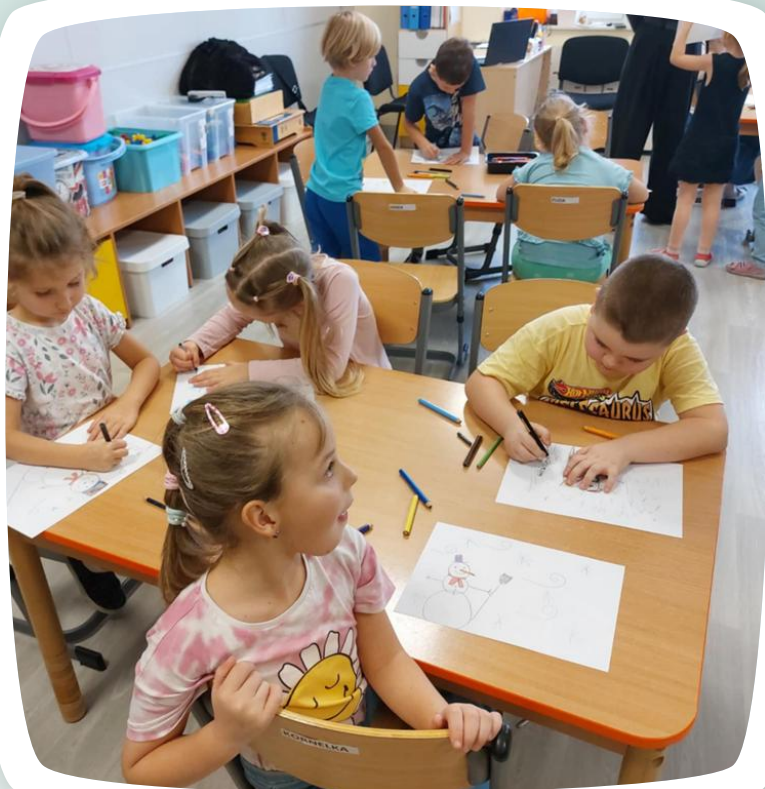
Grupa „Pszczółki” podczas zajęć innowacyjnych ;-)